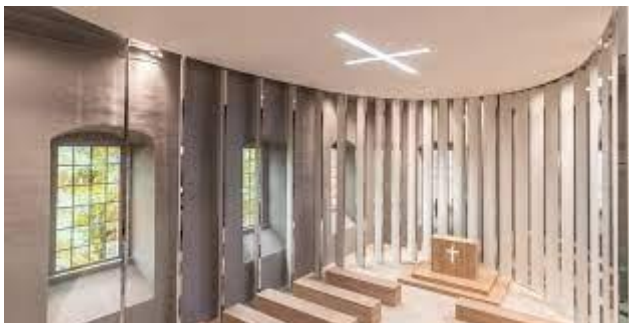
Chapel Leuchtenburg in Thuringen